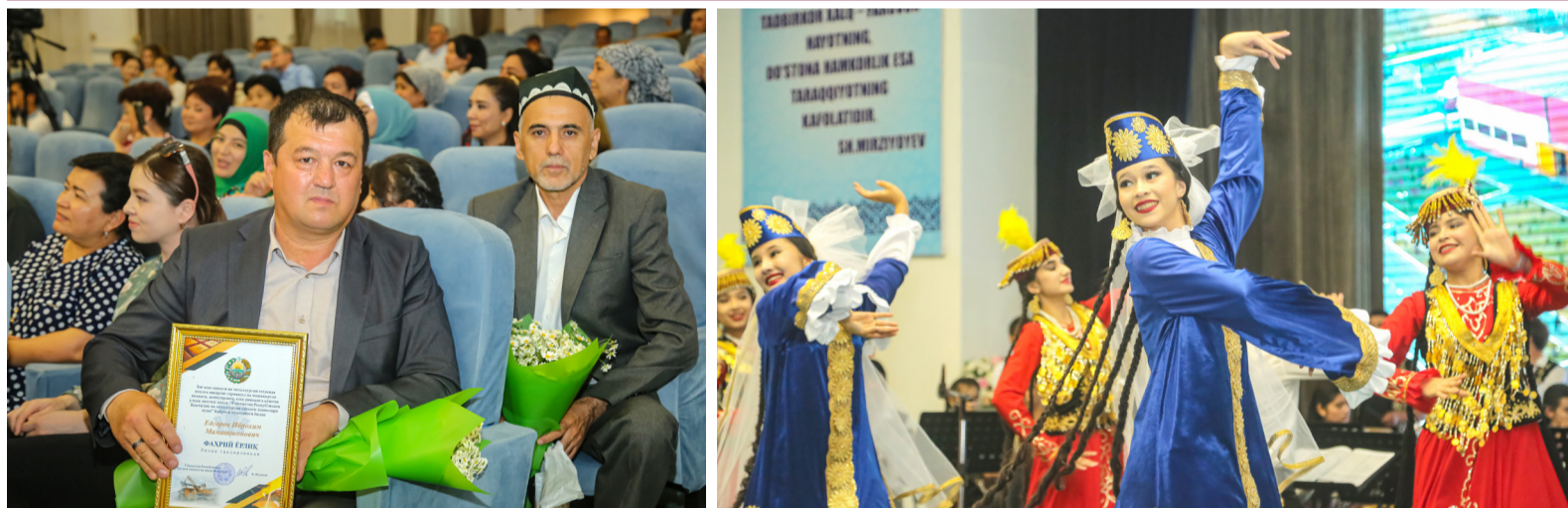
O'ZBEKISTON RESPUBLIKASI KONCHILIK VA METALLURGIYA SANOATI XODIMLARI KUNI TANTANALI NISHONLANDI