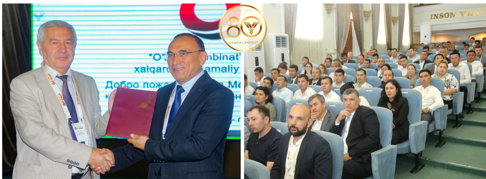
"INNOMET.UZ – 2024" XALQARO ILMIY-AMALIY KONFERENSIYASIDA

2024-yil 29-may № 5 (1539) Gazeta 1992-yil 7-martdan nashr etilmoqda